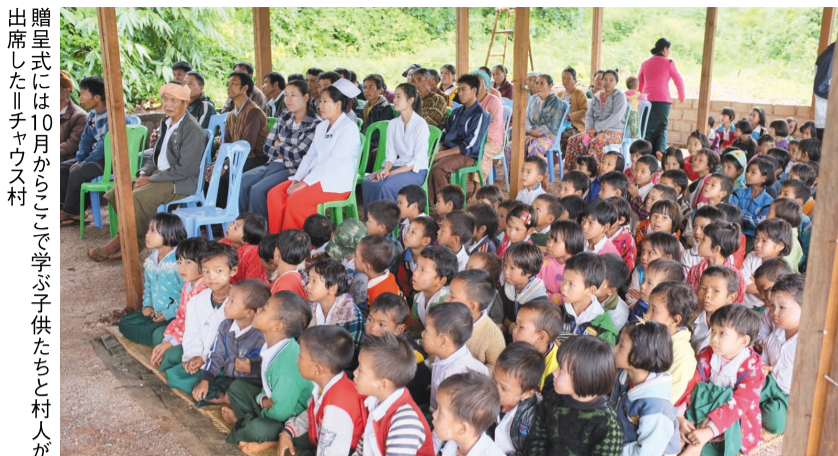
贈呈式には10月からここで学ぶ子供たちと村人が出席した。チャウス村

戸も掘られたばかり。そこに同院長の力添えもあって、待望の小学校ができ、めでたいこと続き。柱に大屋根のつたばかりの建築中の校舎で催された贈呈式には、10月からここで勉強する子供約120人と村長ら大勢の村人が集まり、祝賀ムードに包まれた。