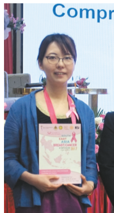
シンポの合間にヤンゴン

私の発表のテーマは「アジア人における自家組織移植による乳房再建の戦略」でした。自家組織とは自分自身の腹部の脂肪や背中の筋肉のことです。 岡山大学形成外科は微小血管吻合術による再建を得意としています。欧米人と比較して、アジア人は一般的に痩せており、採取できる組織量に限りがあります。このため、1本の血管で血流量が不足する場合、さらにもう1本の血管を吻合することで、採取した組織を最大限利用するようにします。つまり、微小血管吻合術を駆使することで状況に応じた乳房再建が可能になる、というのが発表の内容でした。