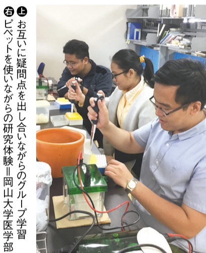
① ② お互いに疑問点を出し合いながらのグループ学習 ③ ビベットを使いながらの研究体験 岡山大学医学部